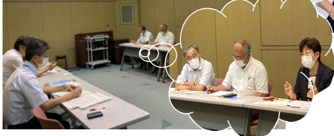
◀⑦県立中央病院長と懇談。地域医療に果たす病院の実情と要望をお聞きする (8/19)