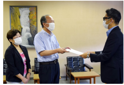
▼①新型コロナ禍の大規模イベントの中止を県に申入れ (8/18)